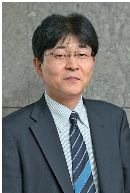
公益社団法人国際観光施設協会 交流部会 設備部会 ㈱三菱地所設計 執行役員 リノベーション設計部長