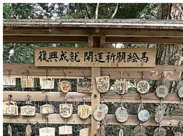
須須神社復興成就開運祈願絵馬