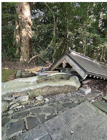
倒壊したままの手水舎

震災を乗り越え、新たな歴史を刻む須須神社の姿は、奥能登復興のシンボルとして、これからの世代に語り継がれていくに違いない。