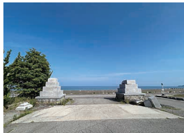
倒壊した須須神社大鳥居、台座だけが残る

境内を象徴していた大鳥居は根元から崩れ、長い歴史を支えてきた建造物群は深刻な損傷を被った。地域住民に