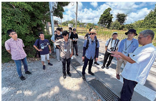
金沢大学・里山里海マイスタープログラム講義風景、講義の前日に須須神社参拝