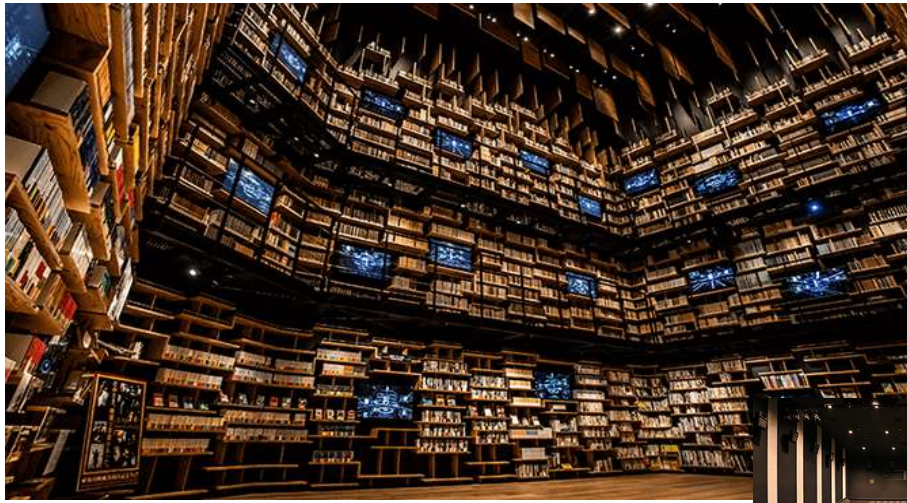
角川武蔵野ミュージアム 本棚劇場

KADOKAWAによる日本最大級のポップカルチャー発信拠点が所沢市に誕生。 ミュージアム・イベント・ホテル・レストラン・書店・オフィス・神社 あらゆる文化をひとつにしたクールジャパンの拠点として世界中のお客様をお迎えします。